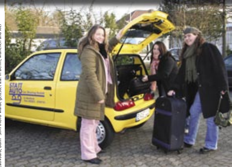
© 2006 | Design: Tomkowitz Kreativbüro, Bonn *STATTAUTO wurde getestet u.a. in Berlin, München und Kiel

Stattauto im SVD-Kundenzentrum Lange Straße 77 32756 Detmold Fon 0 52 31 - 97 77 44 Fax 0 52 31 - 97 77 45